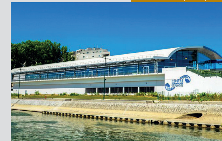
Le centre aquatique