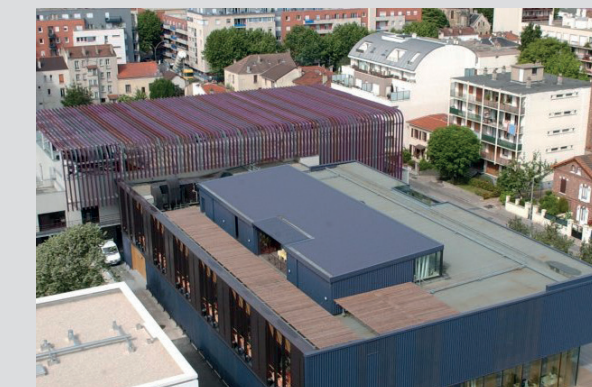
Le centre culturelle