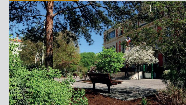
Squares & jardins

Aux portes de Paris, Alfortville est bordée à l'ouest par la Seine et au nord par la Marne.